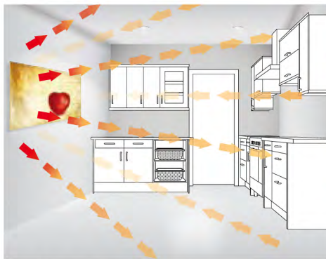
Равномерно и приятно топлинно излъчване с инфрочервено отопление