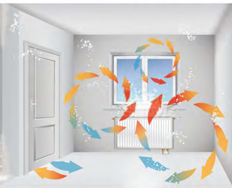
Вдигане на прах и течения при радиаторите